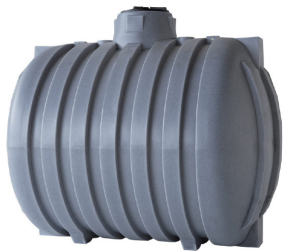
SERBATOI DA INTERRO MONOLITICI