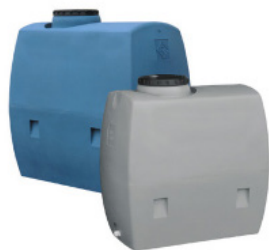
SERIE ORIZZONTALE STRETTA