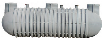
SERBATOI DA INTERRO MODULARI