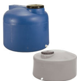
SERIE A PANETTONE