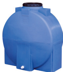
SERIE A DISCO