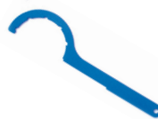
CHIAVE PER RACCORDI A COMPRESSIONE